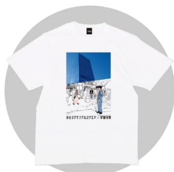
渋谷スクランブルスクエア×宇宙兄弟 Tシャツ 3,000円

「純喫茶 宇宙」ではグッズの販売も。宇宙兄弟公式ストアの新作グッズや「渋谷スクランブルスクエア×宇宙兄弟のコラボレーショングッズ」も登場します。