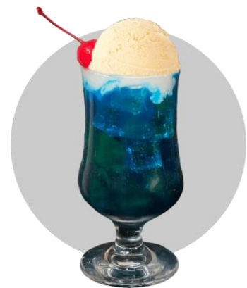
地球カラーフロート 800円