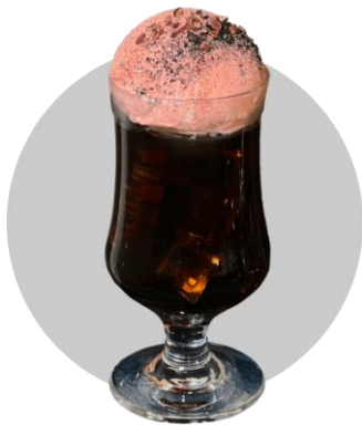
火星コーヒーフロート 800円