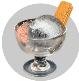
火星・月アイス 800円