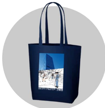
渋谷スクランブルスクエア×宇宙兄弟 トートバッグ 2,000円