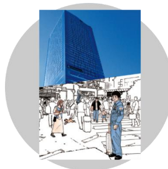
渋谷スクランブルスクエア×宇宙兄弟 ポストカード 300円