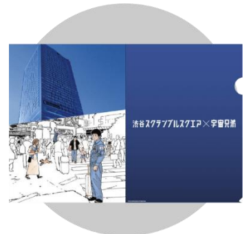
渋谷スクランブルスクエア×宇宙兄弟 クリアファイル 400円